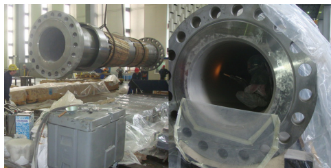
Le gommage cryogénique dans une conduite en acier

CRYONOMIC® a un réseau mondial. Contactez votre revendeur pour des renseignements supplémentaires.