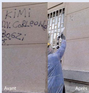
Nettoyage de façades - Antigraffiti

CRYONOMIC®, innovatif et technologiquement avancé