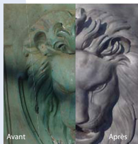
Décapage de peinture