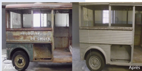
Dérouillage et décapage