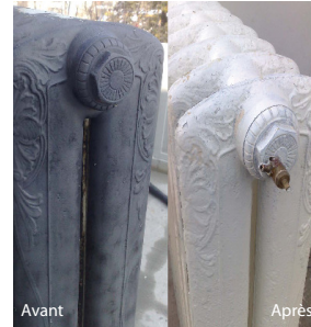
Décapage de peinture