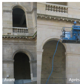
Nettoyage de façades